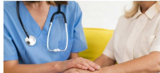
Médico y paciente.

La sociedad solicita que la tramitación de este marco normativo se apoye "al menos con la misma contundencia y celeridad" con la que se respalda la regulación de la eutanasia.