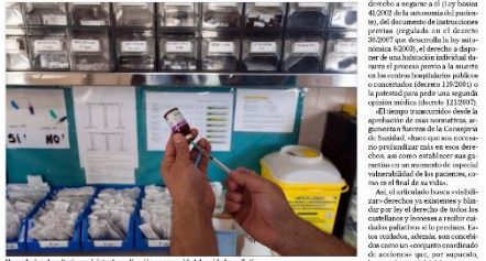
Un profesional cuidando a un paciente en una unidad de cuidados paliativos.