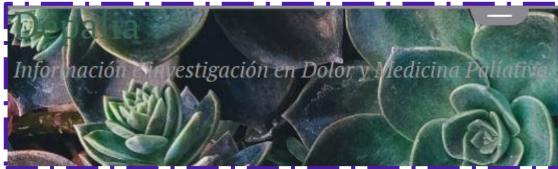
Depalia: Investigación en Dolor y Medicina Paliativa