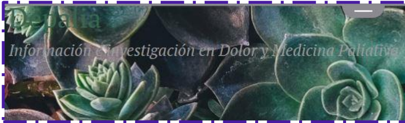
Depalia: Investigación en Dolor y Medicina Paliativa