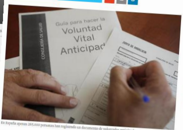
El Registro Nacional de Instrucciones previas en su último recuento a fecha de octubre de 2018 constata que apenas un 0,6% de la población española ha dejado constancia de sus deseos llegada la hora final de la vida.

En España apenas 265.000 personas han registrado de forma oficial un documento de voluntades anticipadas o testamento vital. La Sociedad Española de Cuidados Paliativos apuesta por la Planificación Anticipada de los Cuidados como un avance respecto al testamento vital.